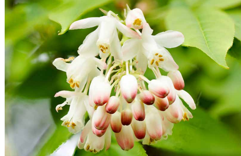
Staphylea pinnata (Pimperness)

Q20, 21, 22 Taxus baccata L. Gewöhnliche Eibe Pflanze giftig! Ausnahme: Roter, fleischiger Samenmantel der Früchte (essbar, süßlich-schleimig). Kann bis zu 1000 Jahre alt werden, das harte Holz ist sehr begehrt. Im Renaissance- und Barockgarten wichtiges Formgehölz. Galt bei den Kelten und Römern als Baum des Todes. Früchte Nahrung für viele Singvögel.